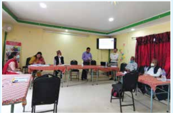
कार्यक्रममा नगर प्रमुख, उप-प्रमुख, सचिवालय सचिव र सहभागिहरू