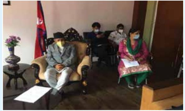
मा. मन्त्रीज्यूको अध्यक्षतामा कार्यकारिणी समितिको बैठक