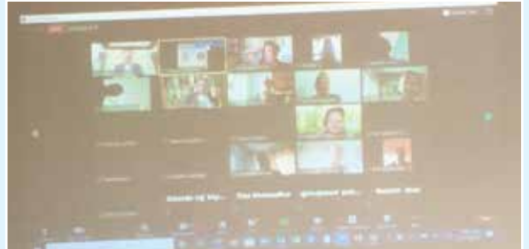
कार्यक्रममा माननीय मन्त्रीज्यू र सहायक महासचिवज्यूबाट वार्षिक प्रतिवेदन प्रस्तुत हुदै ।